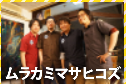
ムラカミマサヒコズ